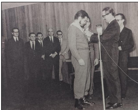
Acima: a condecoração - o ovo da serpente

Acabou-se assim a era Goulart e com ele Brizola e outros esquerdistas. A História é bem clara.