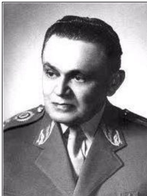
À esquerda, o Marechal Humberto de Alencar Castello Branco, grande líder revolucionário