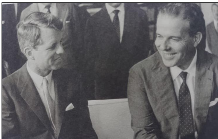
Goulart e Bob Kennedy - 17 de dezembro de 1962