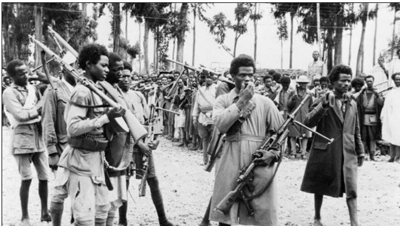
Etiópes reunidos em Adis Abeba – II Guerra Mundial

A Etiópia foi a primeira vitória aliada na Segunda Guerra Mundial. Ao estourar a Segunda Guerra Mundial, a então Abissínia, e antigo Império dos Descendentes do Rei Salomão, eram não só a primeira nação africana que havia conseguido independência. Também era uma das duas que nunca haviam sido colonizadas formalmente.