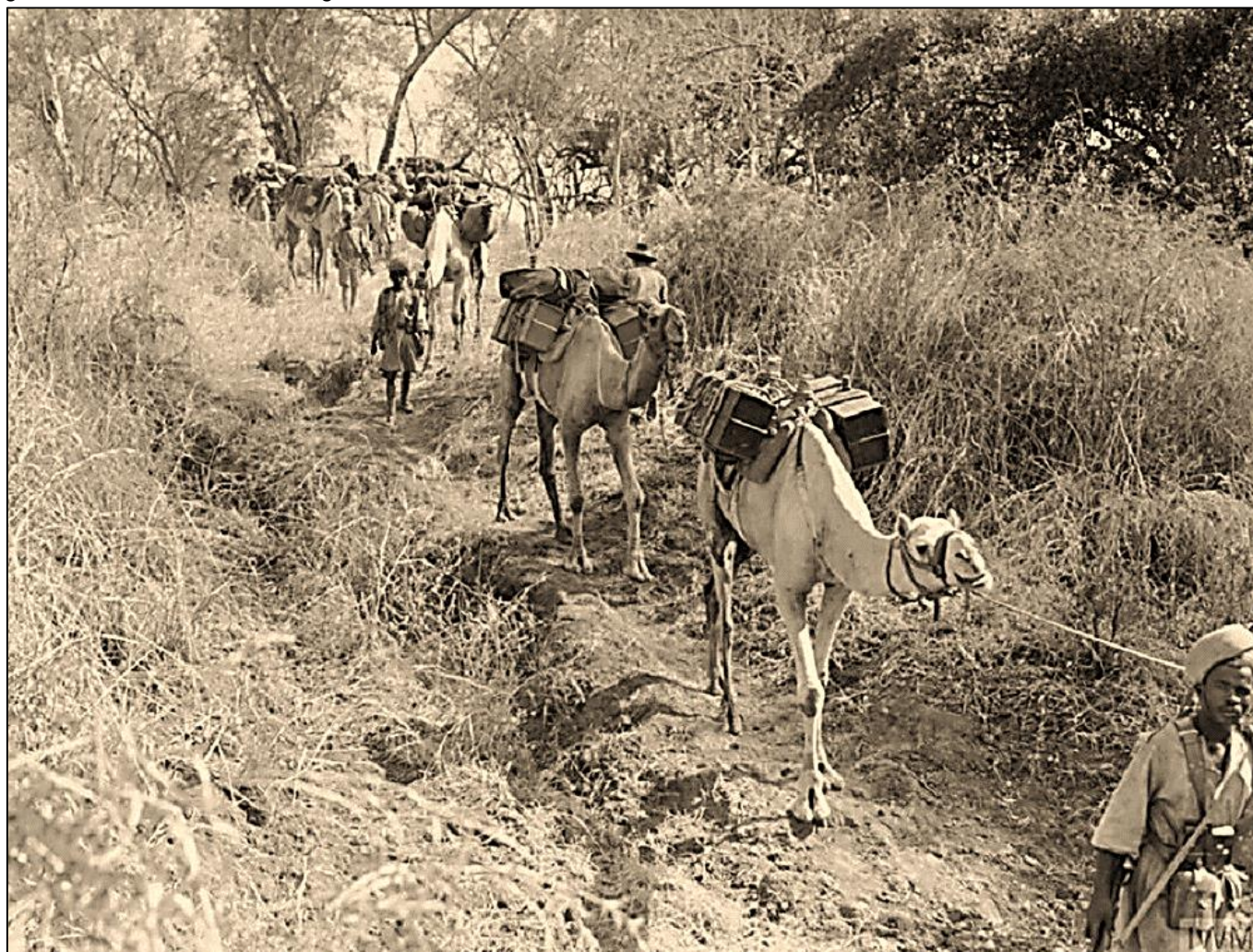
Tropas etíopes transportando suprimentos em camelos – I GM

Foi nela que se denunciou pela primeira vez o uso do gás mostarda desde sua proibição pelo Protocolo de Genebra de 1925. Esse é um dado muito interessante. Os alemães pré-Hitler foram os primeiros a usar o gás mostarda contra os belgas na Primeira Guerra Mundial.