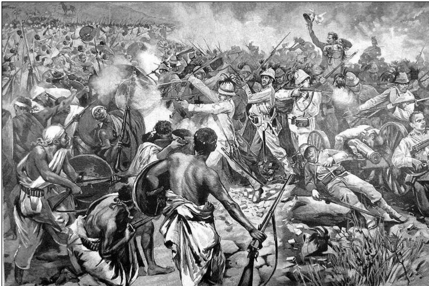
Acima: representação da Batalha de Adwa

Assim, na noite de 1º de março de 1896, 18 mil italianos abandonaram as fortificações e se moveram pelas colinas de Adwa, mas seus mapas eram precários e as forças acabaram isoladas. “A força italiana perdeu não por erro tático”, escreveu Tsegaye Tegeunu. “A principal razão é que, de diversas formas, eles não conheciam o inimigo que estavam confrontando”. Esperavam encontrar 30 mil etíopes e havia mais de