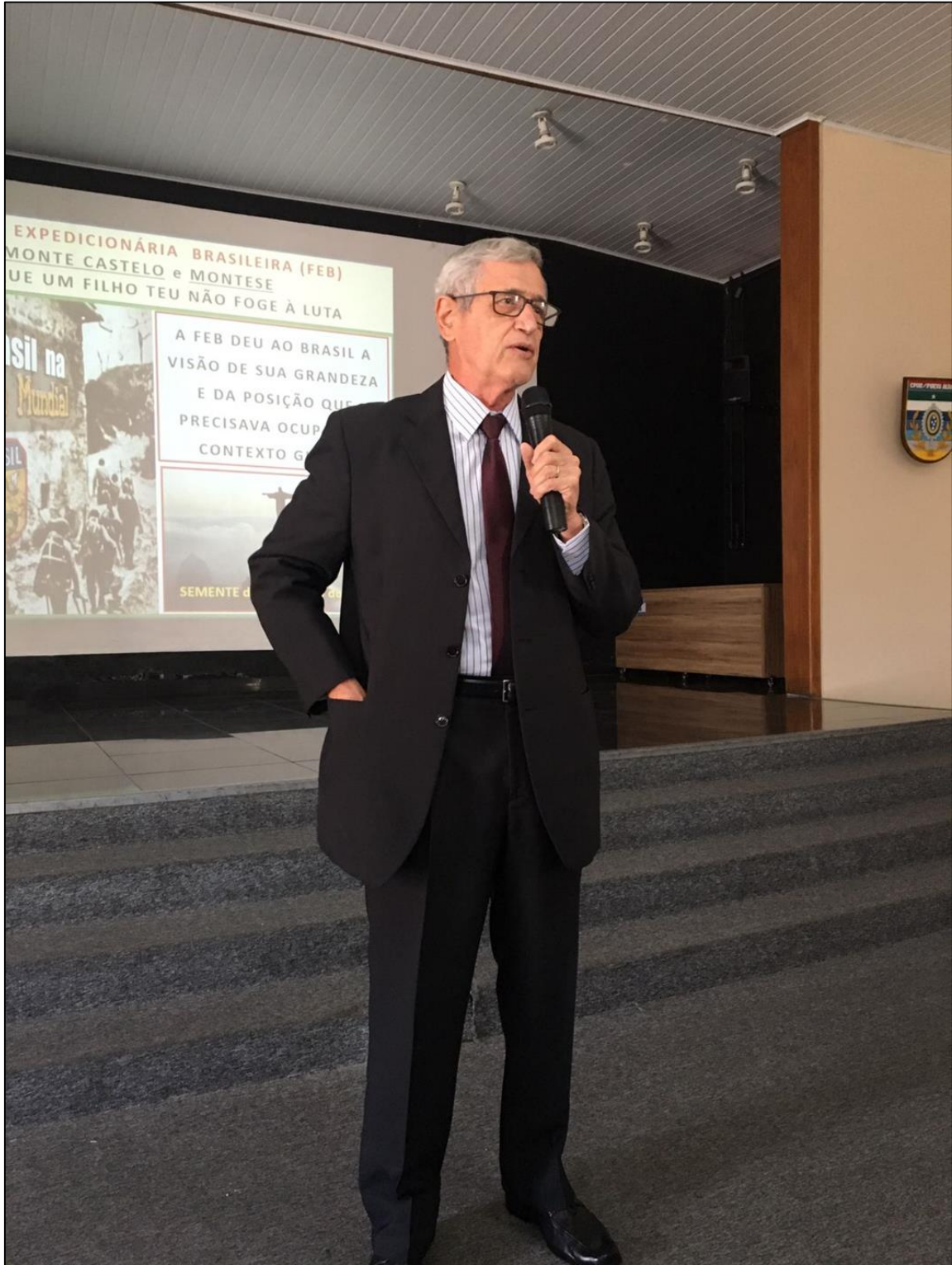
Encerramento, com a mensagem do Gen Rocha Paiva aos alunos