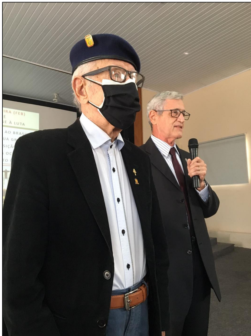
O Veterano da FEB e o Gen Rocha Paiva