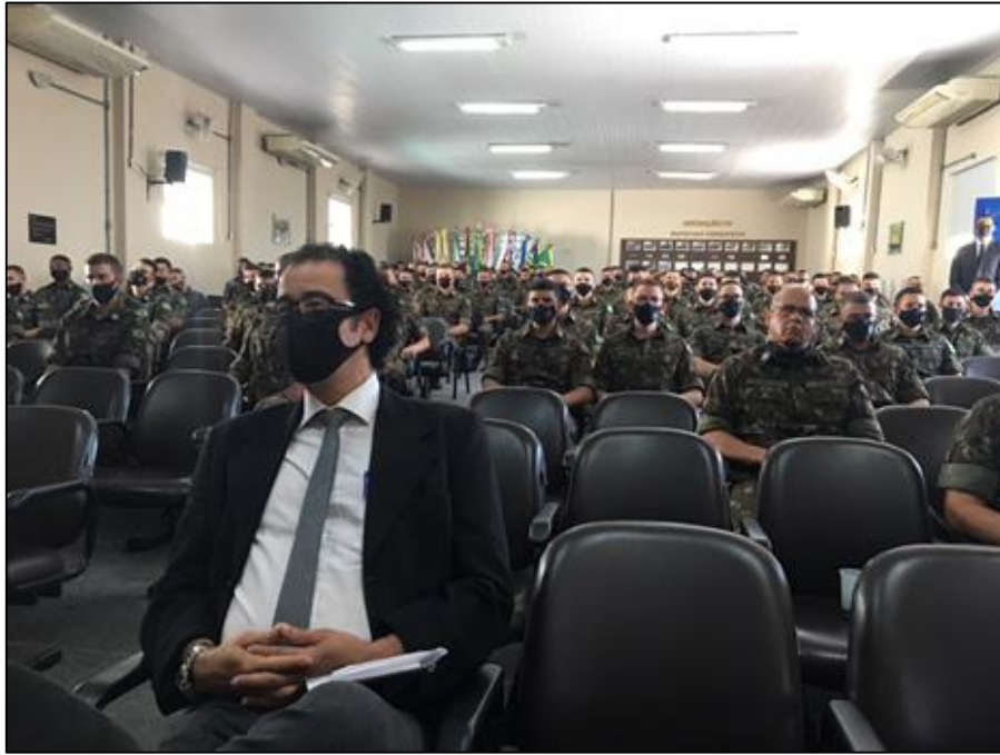
Presença do público, oficiais e alunos