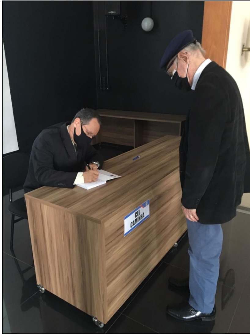
Sessão de autógrafos